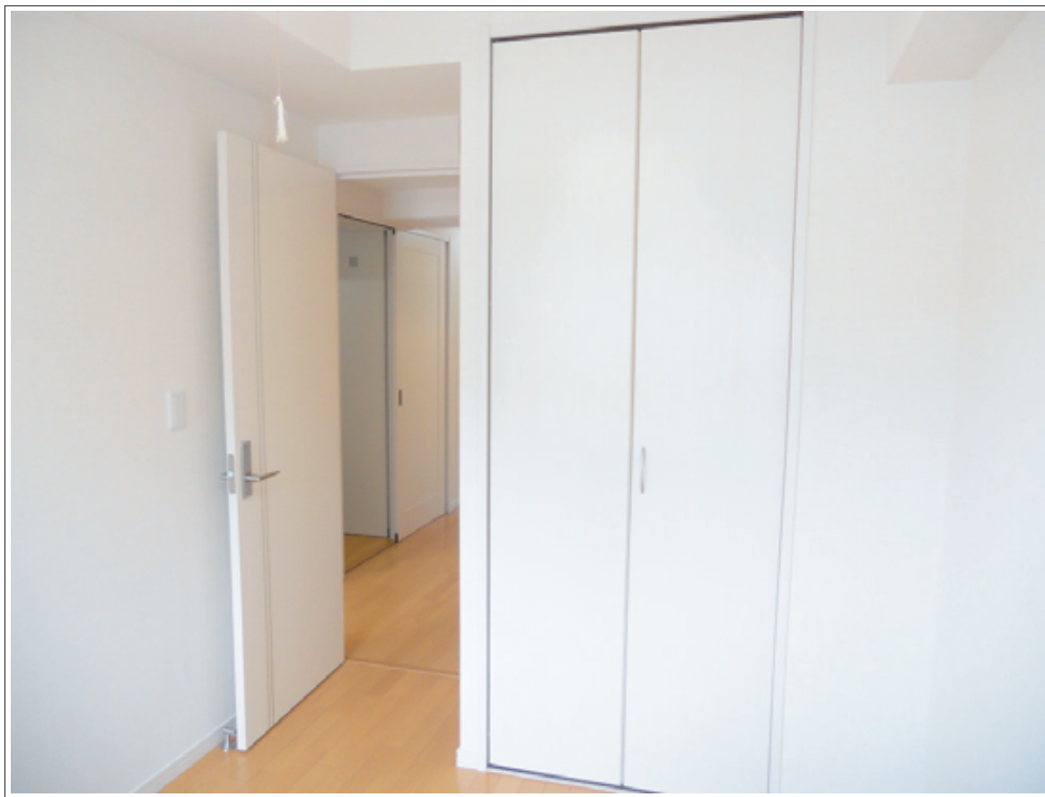
EIDAI製ドア・クロゼット扉使用